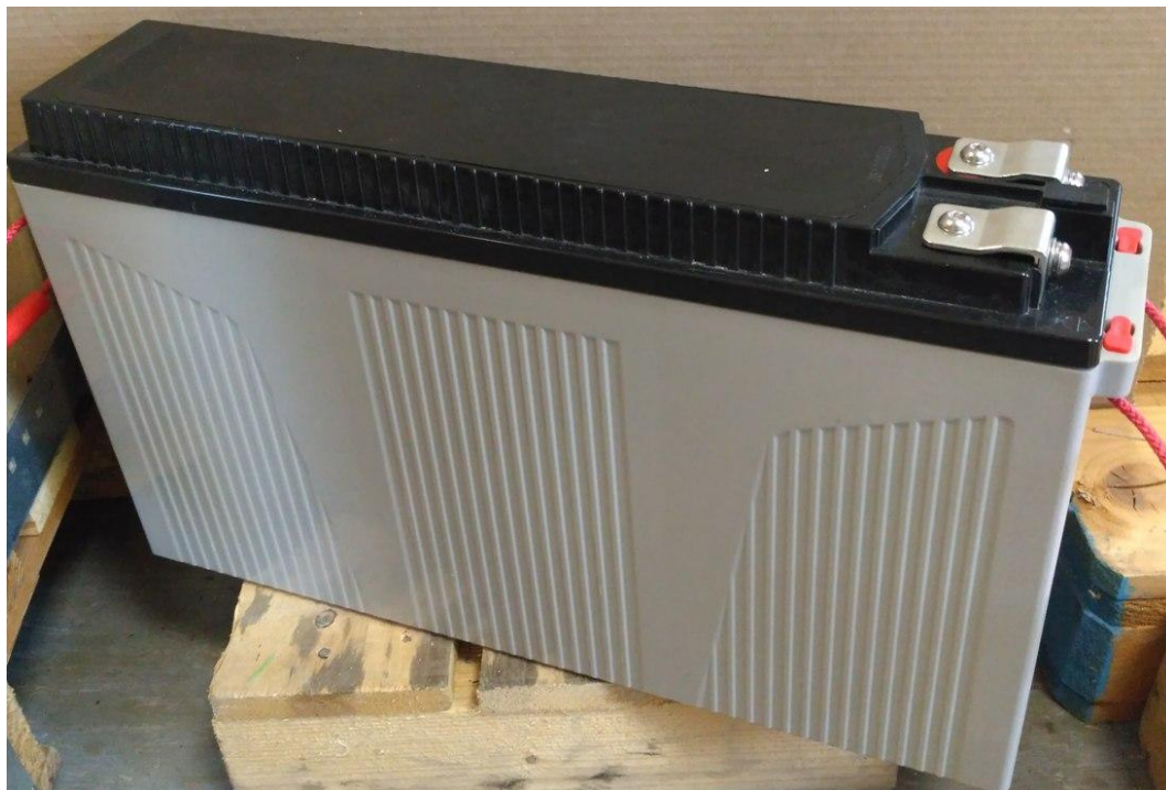
1. Общий вид