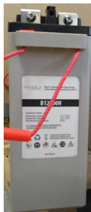
5. Вид спереди