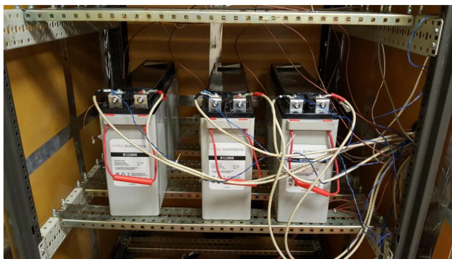
7. Вид образцов №2, №3, №4 при установке в термошкаф