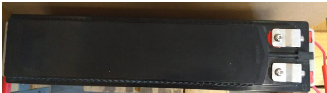
2. Вид сверху, клеммы