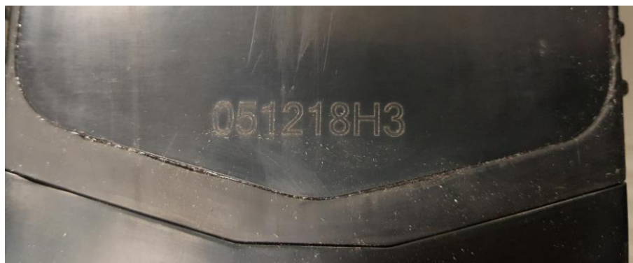
6. Маркировка даты производства (партии)