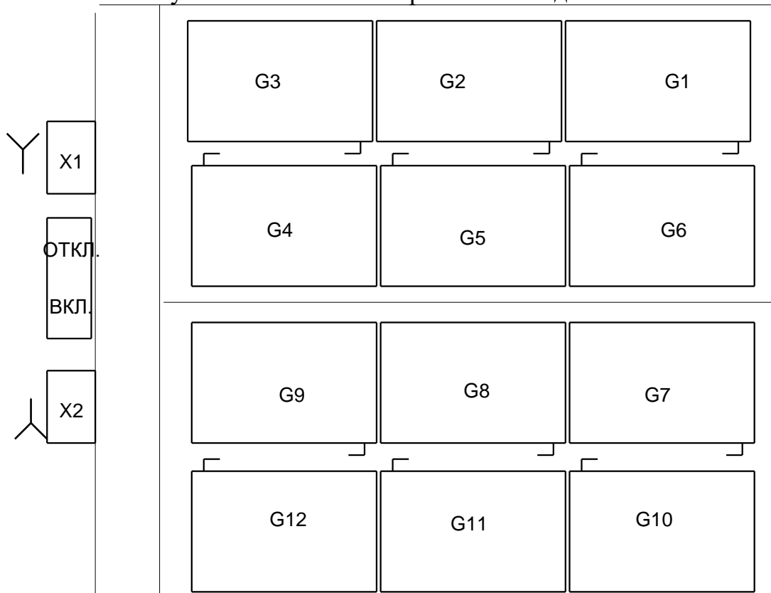
Рисунок 3 – Схема установки и соединений аккумуляторных батарей Комплектность изделия приведена в таблице 1.