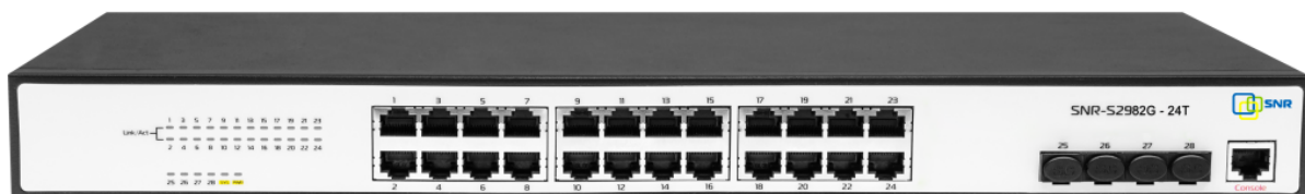
Рисунок 1.1 — Общий вид коммутатора SNR-S2982G-24T.

Коммутатор оснащен 24 портами 10/100/1000 Base-T и 4 портами 100/1000 Base-X SFP.