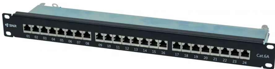
Рисунок 1 - Вид спереди