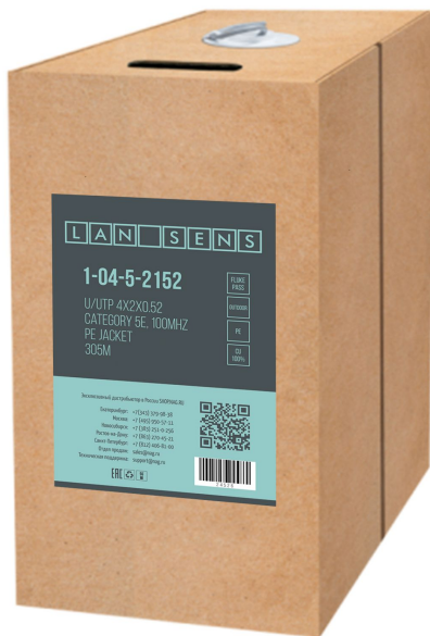
Рисунок 1 - Упаковка