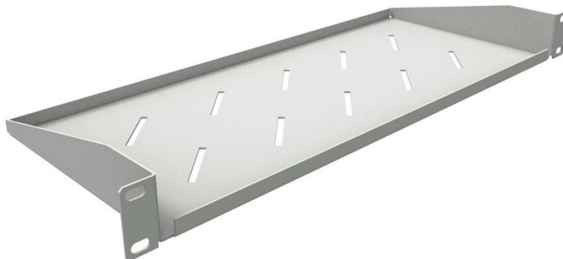
РИСУНОК 1 – ОБЩИЙ ВИД

Общий вид консольной полки изображен на рисунке 1.