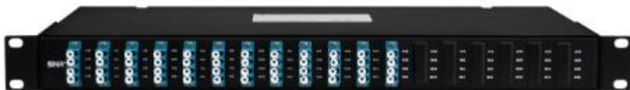
Рисунок 1 - Общий вид