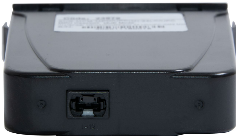
Рисунок 2 - Вид MPO разъемов