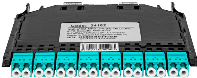
Рисунок 1 - Общий вид