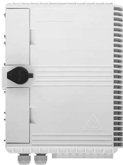
Рисунок 1 - Общий вид