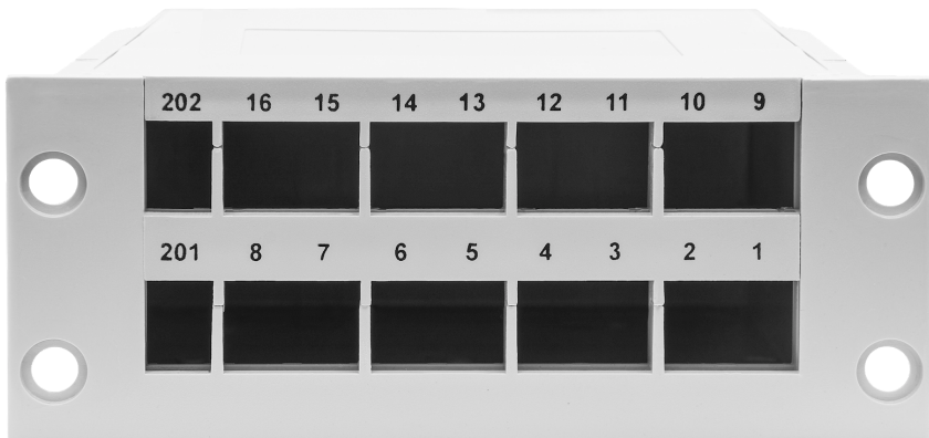
Рисунок 1 - Общий вид