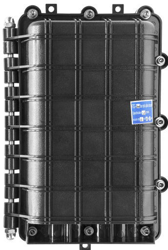
Рисунок 1 - Общий вид