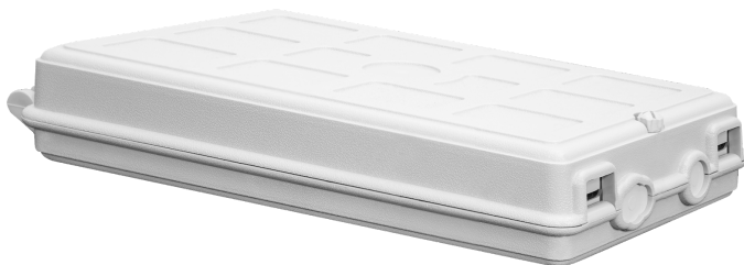
Рисунок 2 - Общий вид