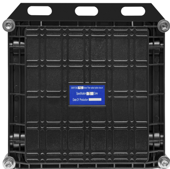
Рисунок 1 - Общий вид