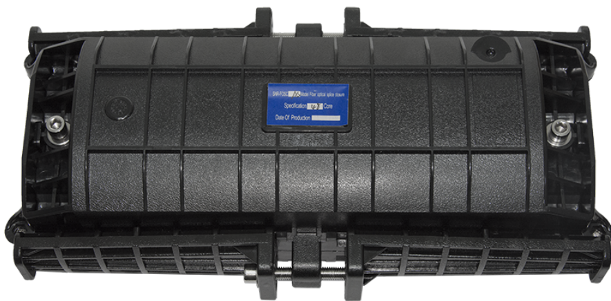
Рисунок 1 - Общий вид