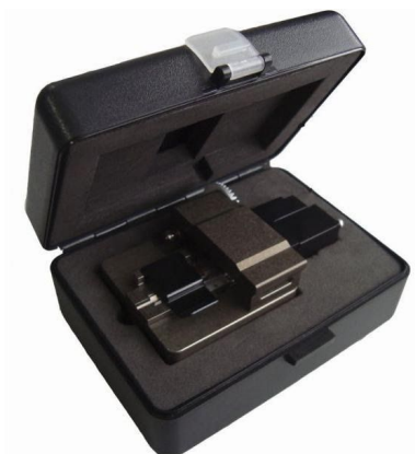
Рисунок 2 - Транспортировочный кейс