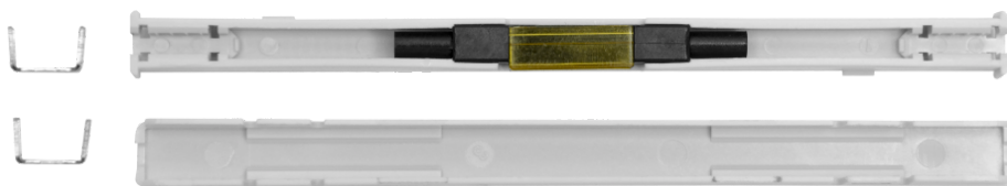
Рисунок 2 - Внутренний конструктив