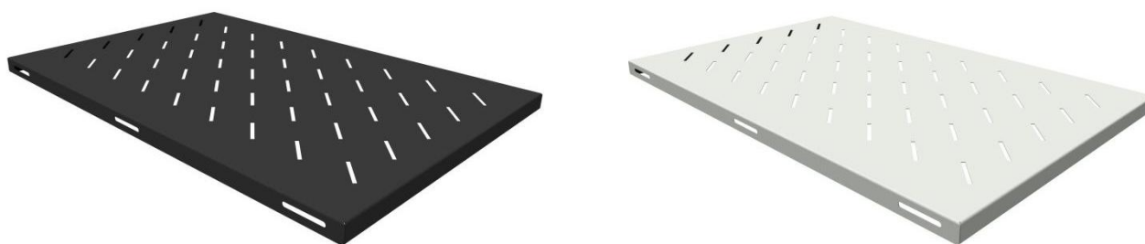
Рисунок 1 - Общий вид стационарной усиленной полки

Полка стационарная усиленная предназначена для установки тяжелого оборудования весом до 250 кг в напольных телекоммуникационных шкафах и стойках. Выполнена из прочного стального листа и покрыта качественной ударопрочной-порошковой краской черного/серого цвета (RAL 9005/7035). Для облегчения конструкции и обеспечения естественной вентиляции за счёт конвекции на поверхность полки имеет перфорацию. Установка полки осуществляется за счёт её крепления к монтажным профилям шкафа в четырёх точках. Полка предназначена для шкафов габаритной глубиной 1000 мм. Полка поставляется в индивидуальной картонной упаковке. Общий вид консольной полки изображен на рисунке 1.