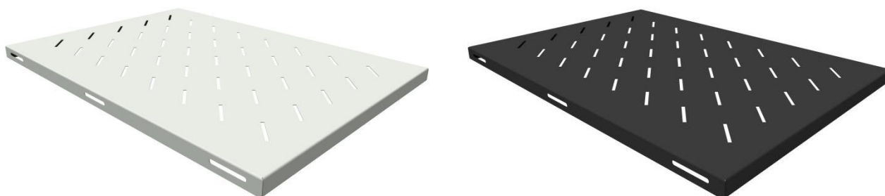
Рисунок 1 - Общий вид стационарной усиленной полки

Полка стационарная усиленная предназначена для установки тяжелого оборудования весом до 250 кг в напольных телекоммуникационных шкафах и стойках. Выполнена из прочного стального листа и покрыта качественной ударопрочной-порошковой краской черного/серого цвета (RAL 9005/7035). Для облегчения конструкции и обеспечения естественной вентиляции за счёт конвекции на поверхность полки имеет перфорацию. Установка полки осуществляется за счёт её крепления к монтажным профилям шкафа в четырёх точках. Полка предназначена для шкафов габаритной глубиной 900 мм. Полка поставляется в индивидуальной картонной упаковке. Общий вид консольной полки изображен на рисунке 1.