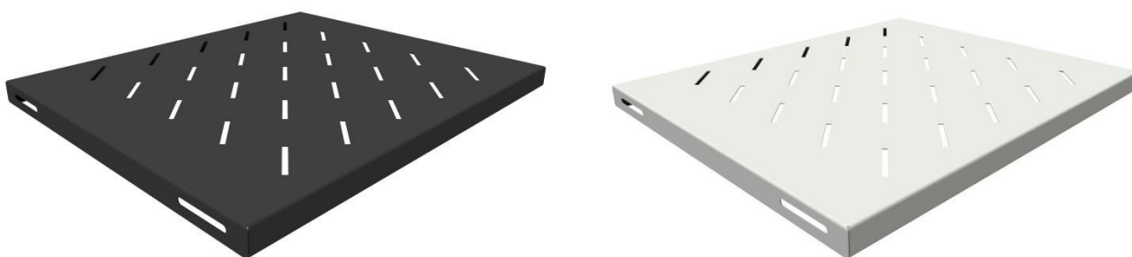
Рисунок 1 - Общий вид стационарной усиленной полки

Полка стационарная усиленная предназначена для установки тяжелого оборудования весом до 250 кг в напольных телекоммуникационных шкафах и стойках. Выполнена из прочного стального листа и покрыта качественной ударопрочной-порошковой краской черного/серого цвета (RAL 9005/7035). Для облегчения конструкции и обеспечения естественной вентиляции за счёт конвекции на поверхность полки имеет перфорацию. Установка полки осуществляется за счёт её крепления к монтажным профилям шкафа в четырёх точках. Полка предназначена для шкафов габаритной глубиной 600 мм. Полка поставляется в индивидуальной картонной упаковке. Общий вид консольной полки изображен на рисунке 1.