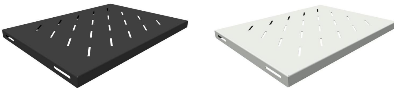
Рисунок 1 - Общий вид стационарной усиленной полки

Полка стационарная усиленная предназначена для установки тяжелого оборудования весом до 120 кг в напольных телекоммуникационных шкафах и стойках. Выполнена из прочного стального листа и покрыта качественной ударопрочной-порошковой краской черного/серого цвета (RAL 9005/7035). Для облегчения конструкции и обеспечения естественной вентиляции за счёт конвекции на поверхность полки имеет перфорацию. Установка полки осуществляется за счёт её крепления к монтажным профилям шкафа в четырёх точках. Полка предназначена для шкафов габаритной глубиной 600 мм. Полка поставляется в индивидуальной картонной упаковке. Полка поставляется в индивидуальной картонной упаковке. Общий вид консольной полки изображен на рисунке 1.