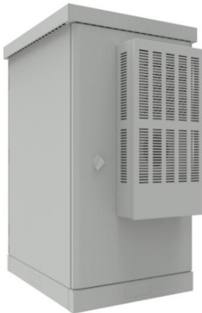
РИСУНОК 1 – ОБЩИЙ ВИД

Общий вид климатического шкафа изображён на рисунке 1, 2.