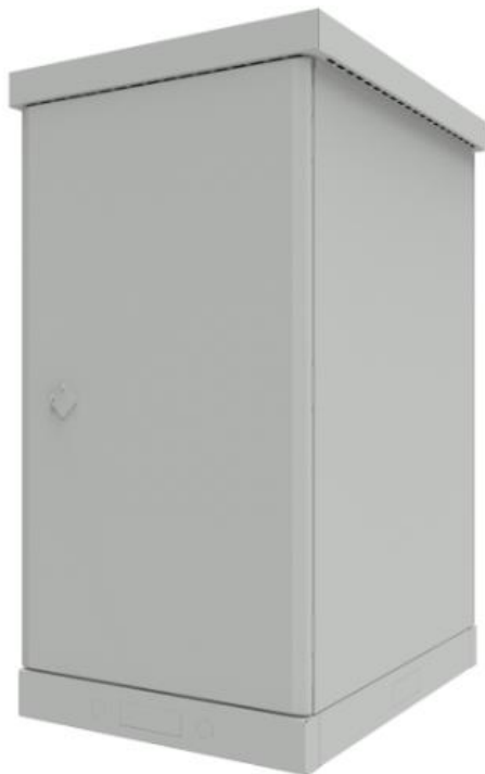
РИСУНОК 2 – ВИД СПЕРЕДИ