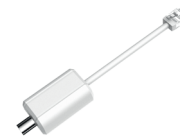
LR1002 Конвертер ePoE – коаксиальный кабель