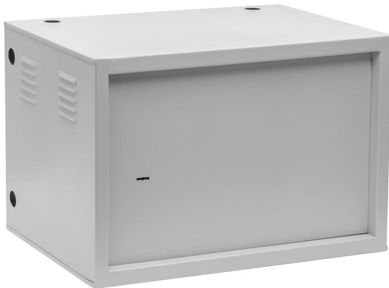
РИСУНОК 1 – ОБЩИЙ ВИД

Общий вид антивандального шкафа изображен на рисунках 1, 2.