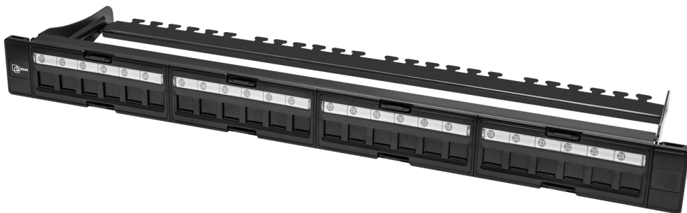
Рисунок 1 - Вид спереди