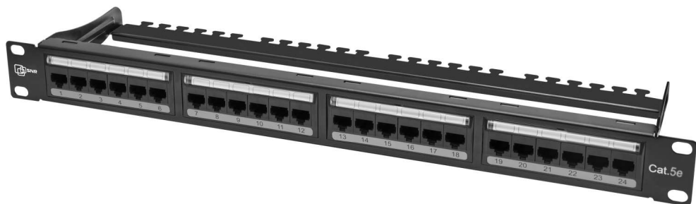
Рисунок 1 - Вид спереди