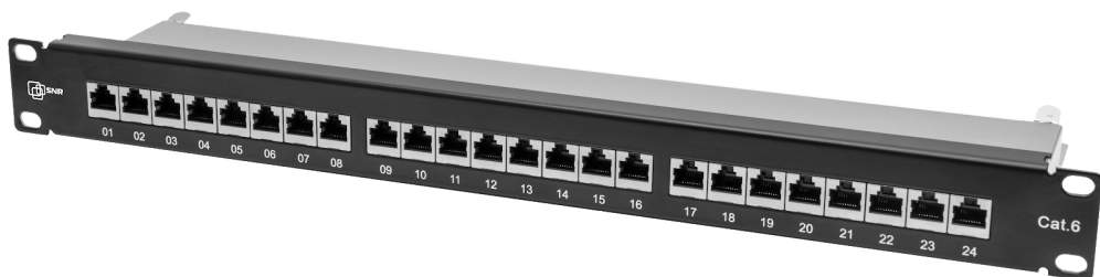
Рисунок 1 - Вид спереди