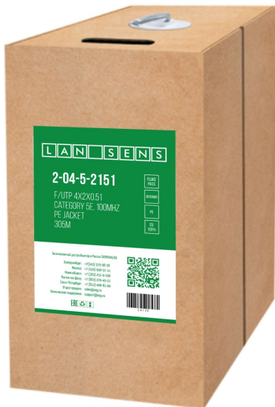
Рисунок 1 - Упаковка