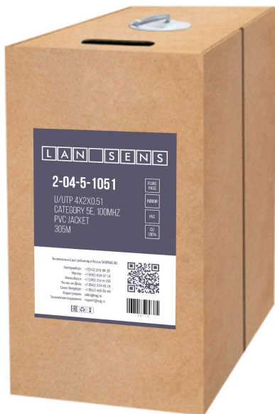
Рисунок 1 - Упаковка