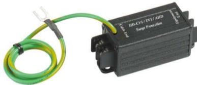
Рис.1 Внешний вид SP009T