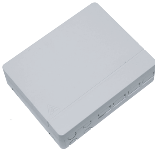
Рисунок 1 - Общий вид