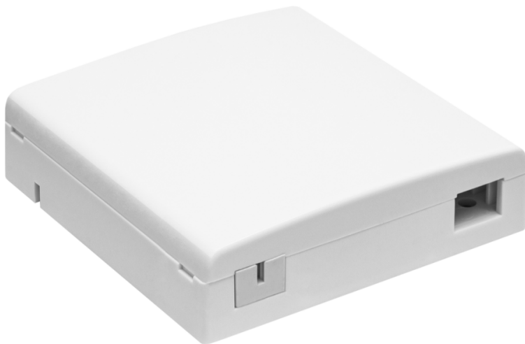
Рисунок 1 - Общий вид