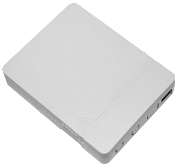
Рисунок 1 - Общий вид