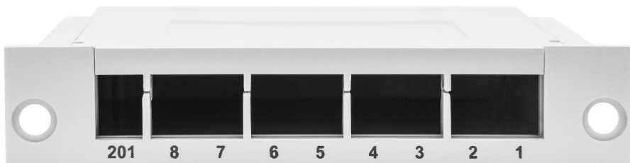
Рисунок 1 - Общий вид