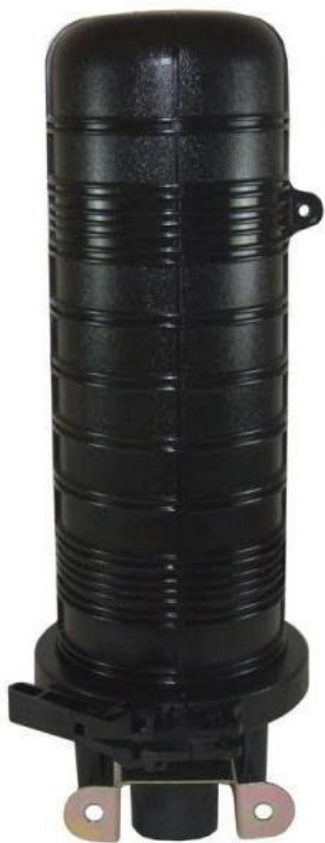
Рисунок 1 - Общий вид