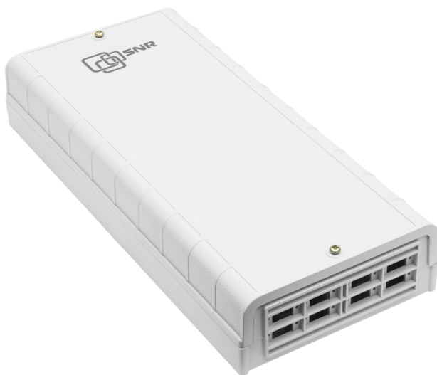
Рисунок 1 - Общий вид