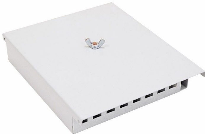
Рисунок 1 - Общий вид