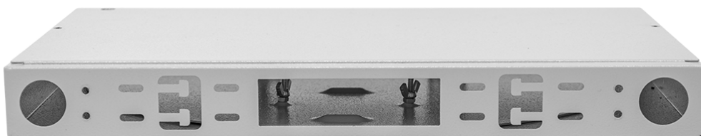
Рисунок 2 - Кабельные вводы