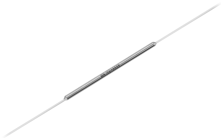
Рисунок 1 - Общий вид