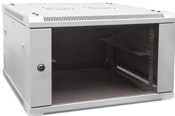
РИСУНОК 2 – ОБЩИЙ ВИД

Общий вид шкафа серии TWC изображён на рисунке 2.