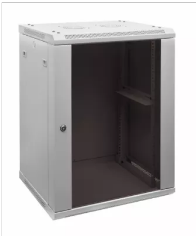
РИСУНОК 2 – ОБЩИЙ ВИД

Общий вид шкафа серии TWC изображён на рисунке 2.