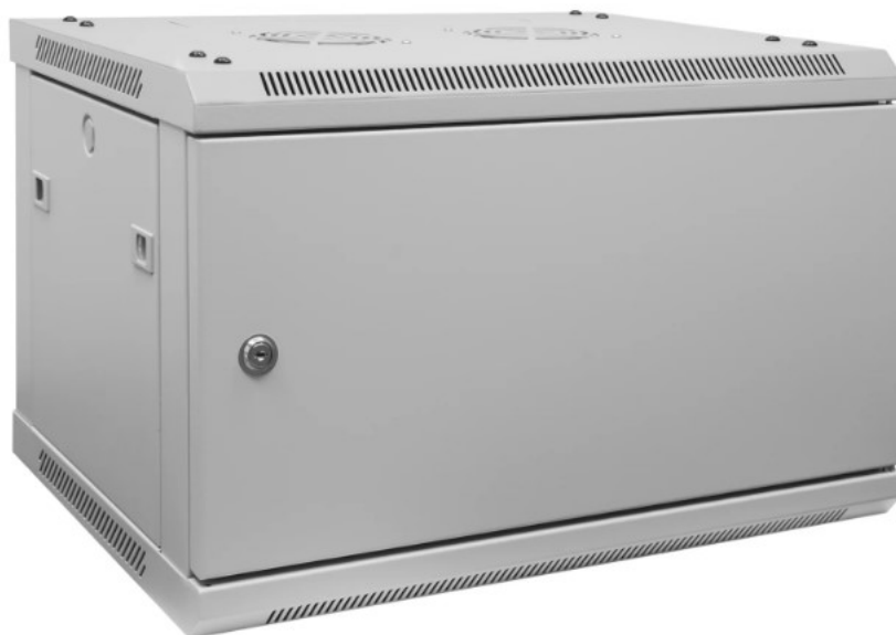
РИСУНОК 3 – ВИД ТЫЛ