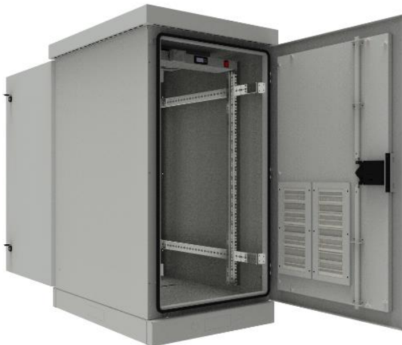
РИСУНОК 1 – ОБЩИЙ ВИД

Общий вид климатического шкафа изображён на рисунке 1, 2.