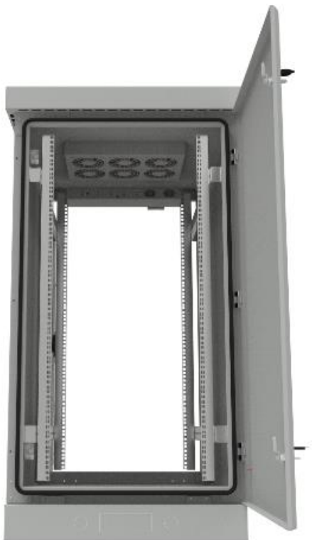
РИСУНОК 2 – ВИД СПЕРЕДИ