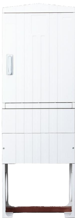
Рисунок 2 – Вид спереди