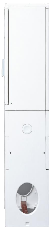
Рисунок 3 – Вид сбоку