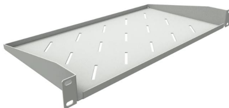
Рисунок 1 – Полка в сером цвете

На рисунках 1 и 2 представлен общий вид консольной полки.