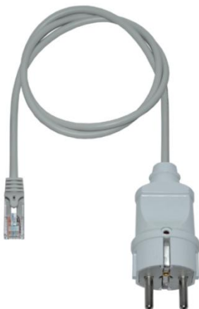
Рисунок 1 - Внешний вид

1.3 Внешний вид и условная схема подключения датчика напряжения к оборудованию автоматизации и мониторинга представлены на рисунках 1 и 2.