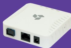
Абонентские терминалы ONU

Компания НАГ обладает большим ассортиментом решений xPON-оборудования от самых разных производителей, что позволяет подобрать оптимальный вариант для любого заказчика. Среди возможных решений имеются абонентские устройства с RF-портом (для CATV), а также оборудование XGS-PON, которое считается новинкой на рынках России и стран СНГ.