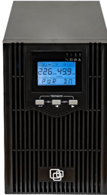
Рисунок 1 - ВИД ПЕРЕДНЕЙ ПАНЕЛИ ИБП