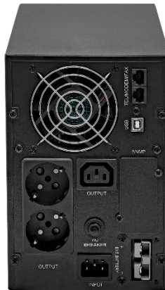
Рисунок 2 -ВИД ЗАДНЕЙ ПАНЕЛИ ИБП