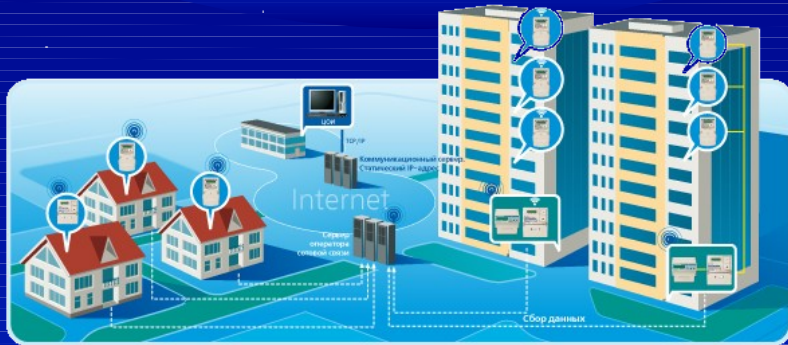
Данные об опросах прибора

Разработан и внедрен новый интуитивно понятный, функционально комфортный интерфейс