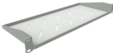
Рисунок 1 – Полка в сером цвете

На рисунках 1 и 2 представлен общий вид консольной полки.